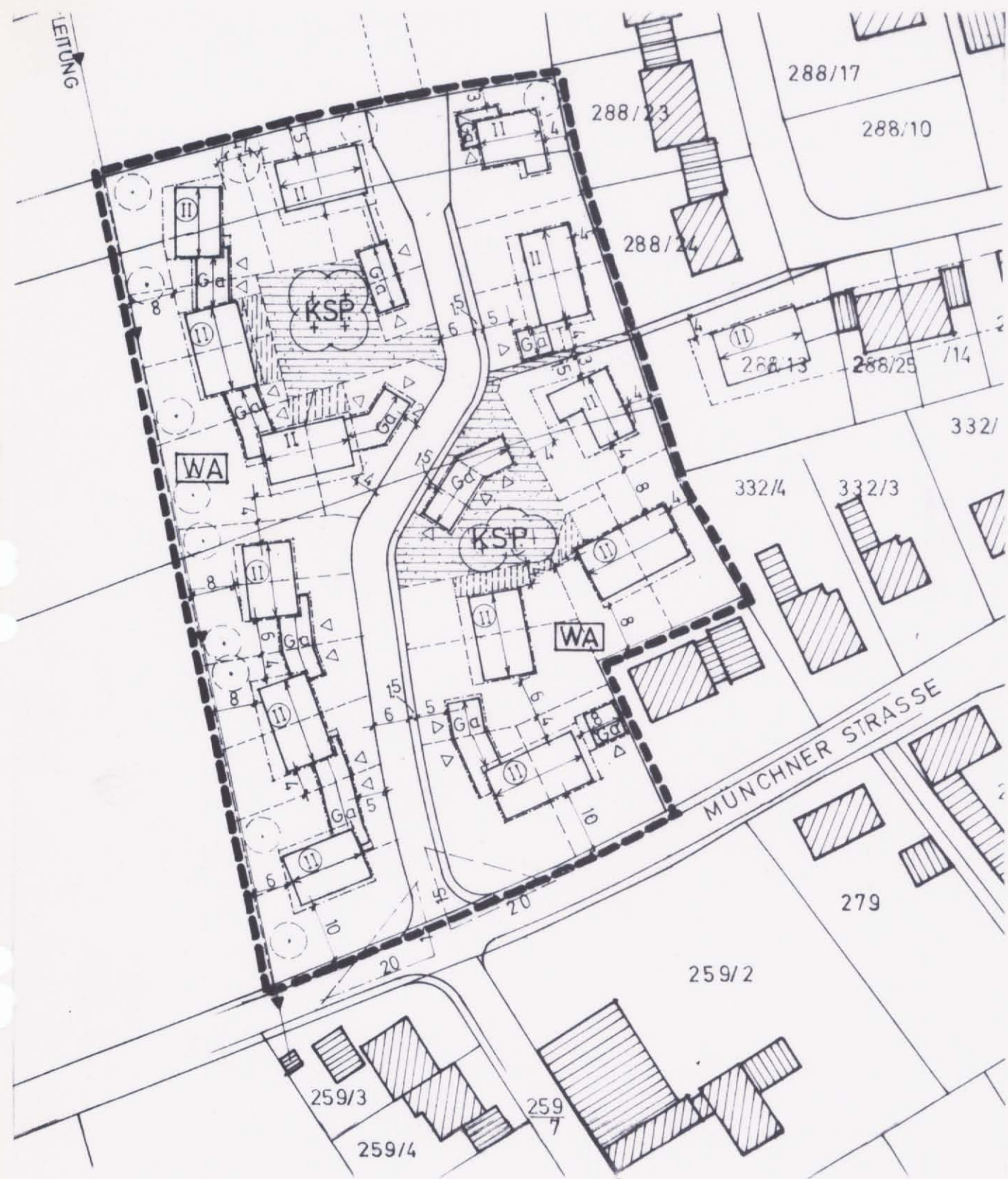
URSPRÜNGLICHE FASSUNG DES BEBAUUNGSPLANES