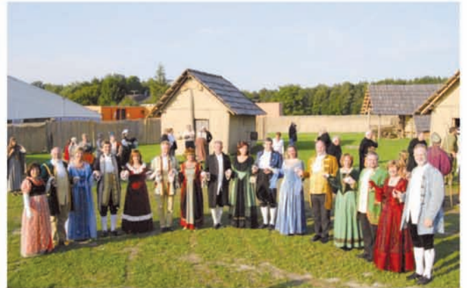
Freilichttheater in Buch am Buchrain im Jahre 2008

Weitere Reisen zu vielen Tanzfesten im alpenländischen Raum folgten, und somit konnten viele schöne Erinnerungen bei der Jubiläums-Feier ausgetauscht werden.