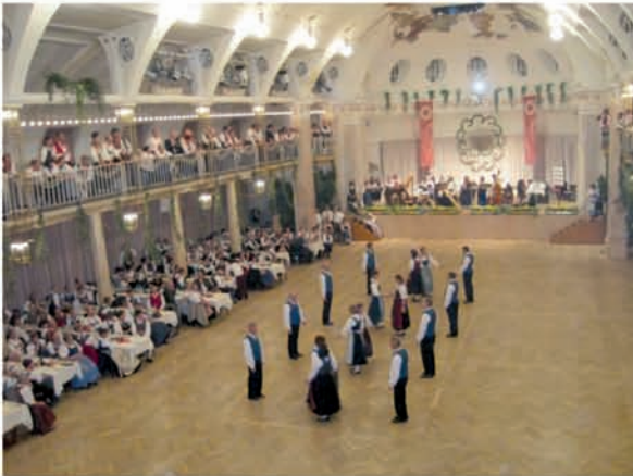
Pausengestaltung beim Kathreintanz der Südtiroler Volkstänzer im Kursaal in Meran im Jahre 2009

Tanzen erhält jung, und Tanzen ist die gesündeste Sportart: dies ist immer noch die Triebfeder für etwa 20 Freunde des bayrischen Volkstanzes, die sich seit 25 Jahren regelmäßig in Forstern zum Tanzen und auch Feiern trifft.