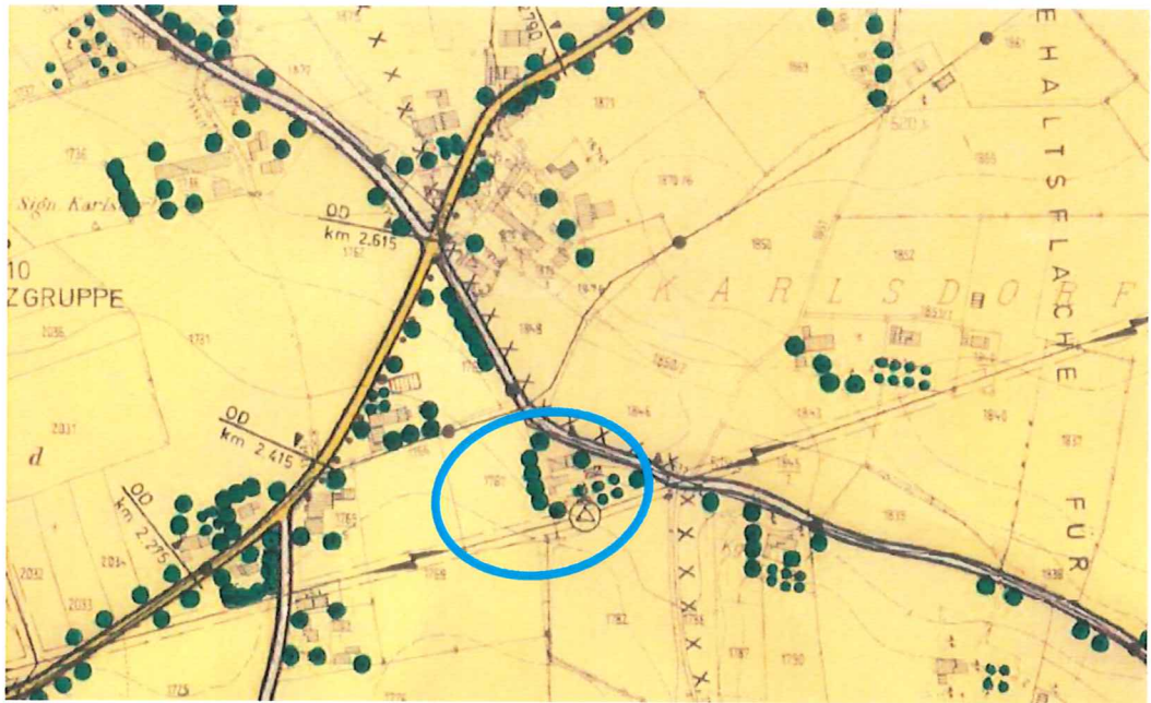
Abbildung: Ausschnitt rechtswirksamer FNP mit blauer Umrandung des Plangebietes

Die 9. Änderung des Flächennutzungsplans stellt den westlichen Teil des Plangebietes als Allgemeines Wohngebiet und den östlichen Teil weiterhin als Fläche für die Landwirtschaft mit einer Hofstelle im Außenbereich dar. Zwischen den Teilbereichen sowie südlich des Allgemeinen Wohngebietes liegt ein Grünstreifen für Gehölzpflanzungen. An der Südgrenze des Plangebietes verläuft eine 20 kV-Freileitung