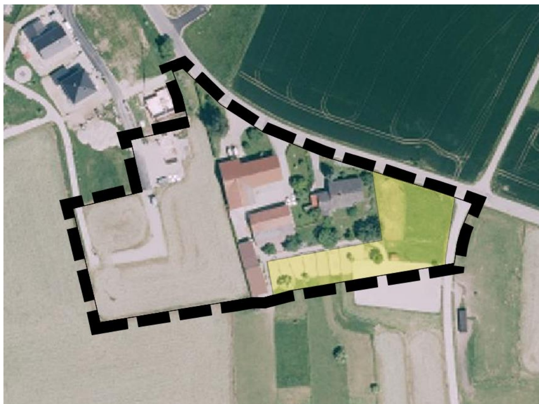
Luftbild des Landesamtes für Digitalisierung, Breitband und Vermessung, DOP 20, 2015

Folgende Abbildung zeigt eine Luftbildaufnahme der Eingriffsfläche (gelb markiert) aus dem Jahr 2015: