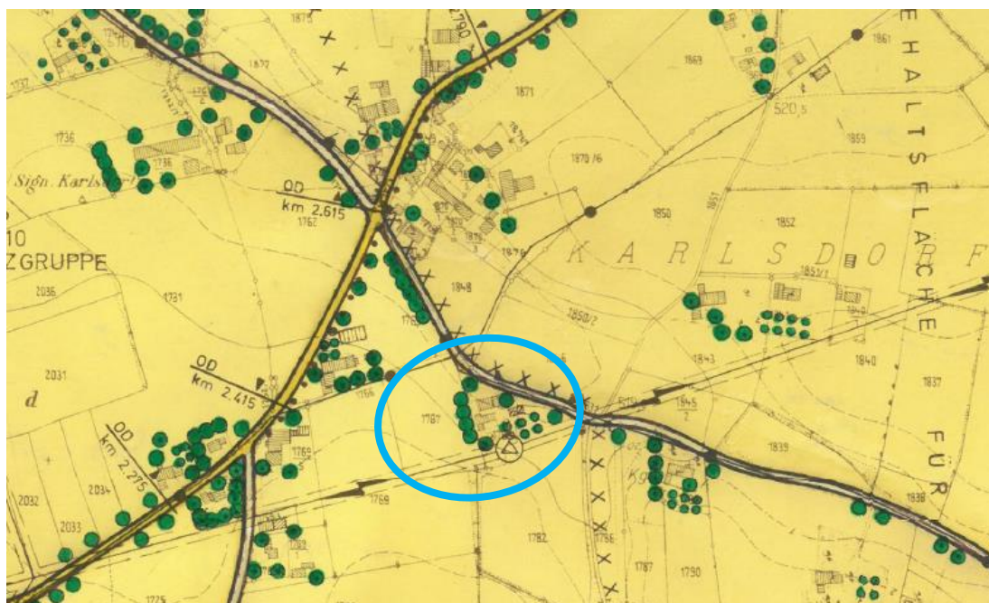
Abbildung: Ausschnitt rechtswirksamer FNP mit blauer Umrandung des Plangebietes

Die 9. Änderung des Flächennutzungsplans stellt den westlichen Teil des Plangebietes als Allgemeines Wohngebiet und den östlichen Teil weiterhin als Fläche für die Landwirtschaft mit einer Hofstelle im Außenbereich dar. Zwischen den Teilbereichen sowie südlich des Allgemeinen Wohngebietes liegt ein Grünstreifen für Gehölzpflanzungen. An der Südgrenze des Plangebietes verläuft eine 20 kV-Freileitung